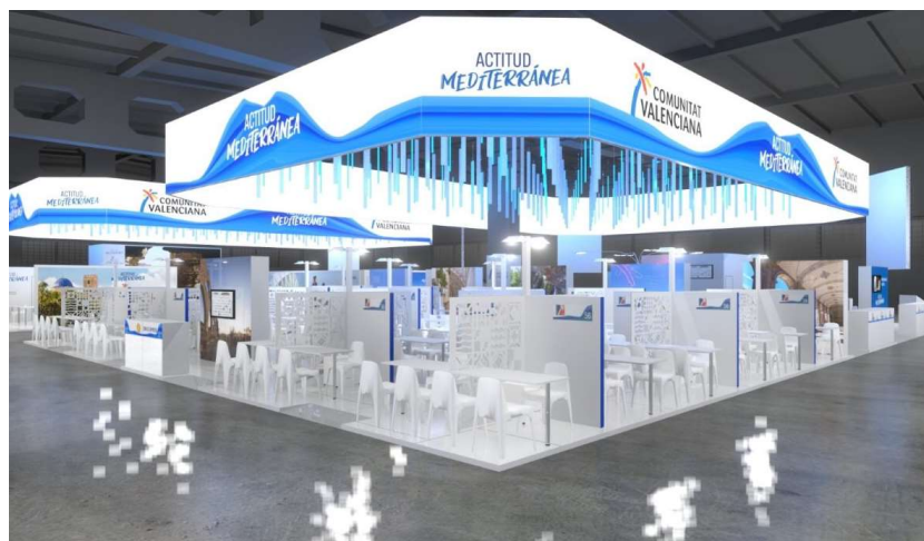
Zona de Empresa con 56 booths