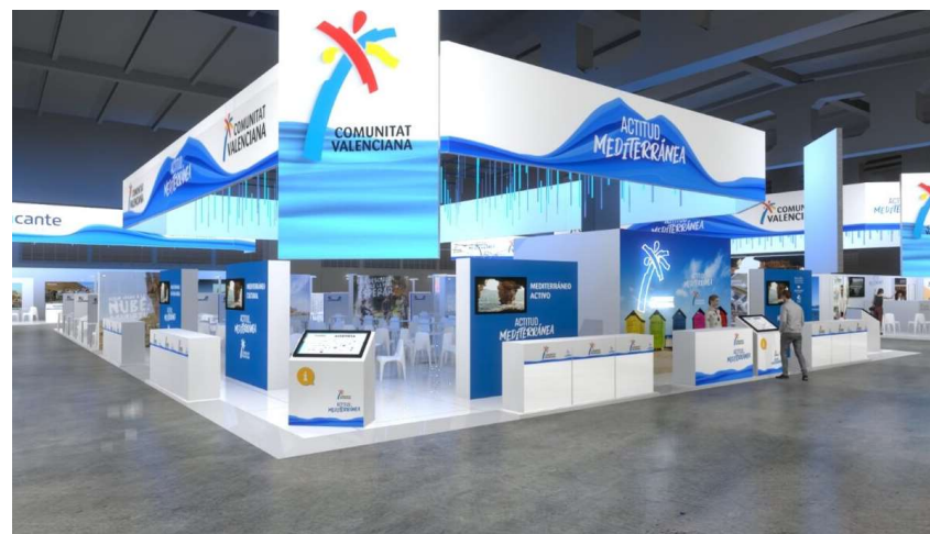
Zona Expositiva de Producto-Creaturisme