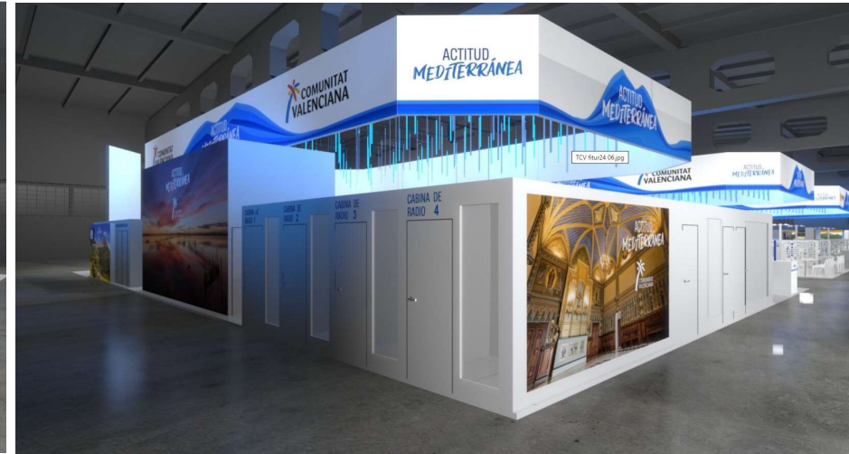
Espacios de trabajo para medios de comunicación