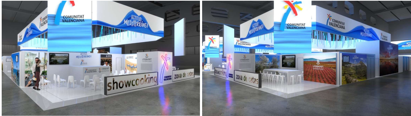
Showcooking y Zona de Catas