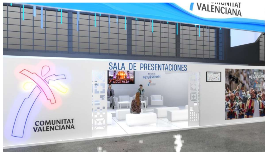
Sala de Presentaciones