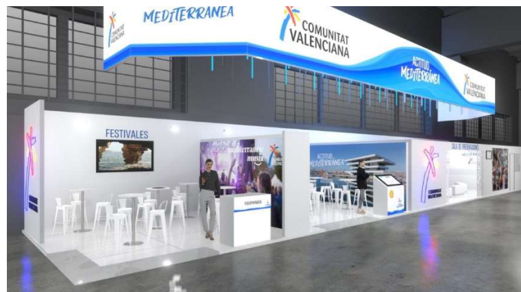
Zona Festivales y Empresas Tecnológicas